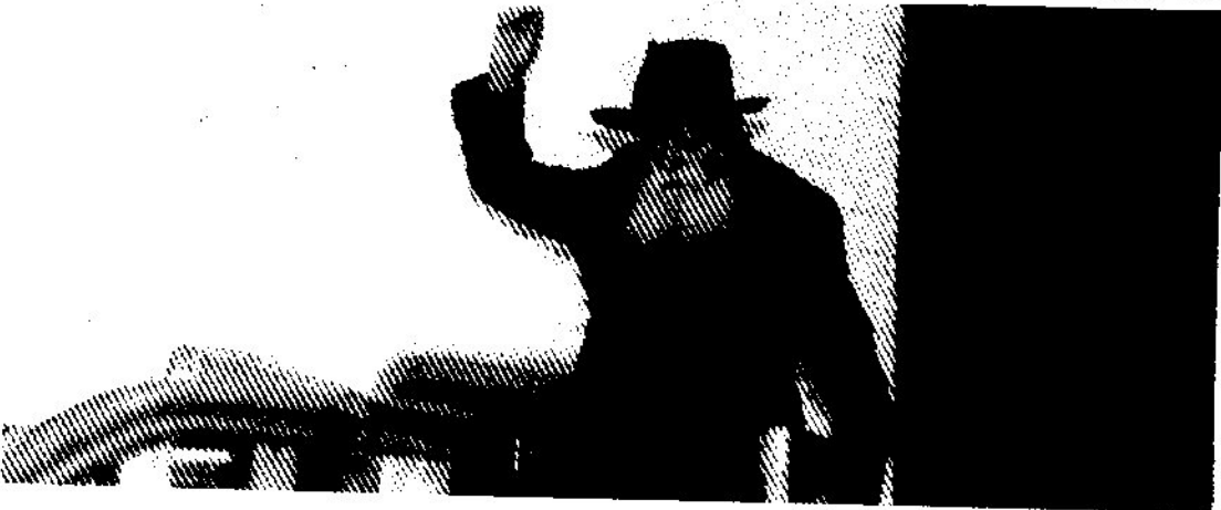
עידוד שירה 'עוצו עצה' - מוצאי עשרה בטבת

הביאו לרבי מים לנטיי ולאחר מכן חזר ממקום החלוקה אל מקומו הקבוע לתפילה. בתוך כך שר הקהל בהתלהבות עוצו עצה ותופר וכאשר הרבי הגיע למקומו, היסב את פניו