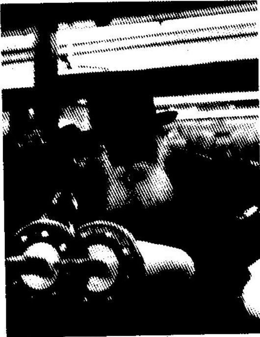
תפילת מנחה - עשרה בטבת

בתפילת שחרית נכה קהל רב יחסית לימי החול כי רבים באו להתפלל ביום הצום במחיצת הרבי. התפילה היתה בהתרוזמות ובאווירה מיוחדת. ברחמנא דעניי וביאבינו מלכנוי שרו את הניגונים הידועים והרבי עודד בידו הק' ע"ג הסטנדר.