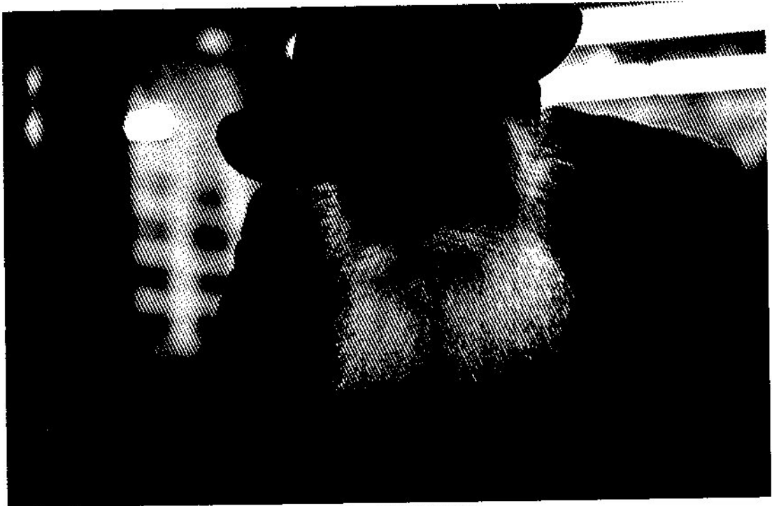
בעת קריאת המפטיר - עשרה בטבת