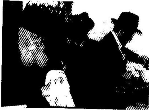
נסילה ידים לתפילת ערבית - מוצאי עשרה בטבת