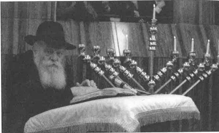
כ"ק אדמו"ר שליט"א בעת הדלקת נרות חנוכה

באמצע כל השידורים שאל כ"ק אדמו"ר שליט"א את הריל"ג כמה דברים בקשר לזה.