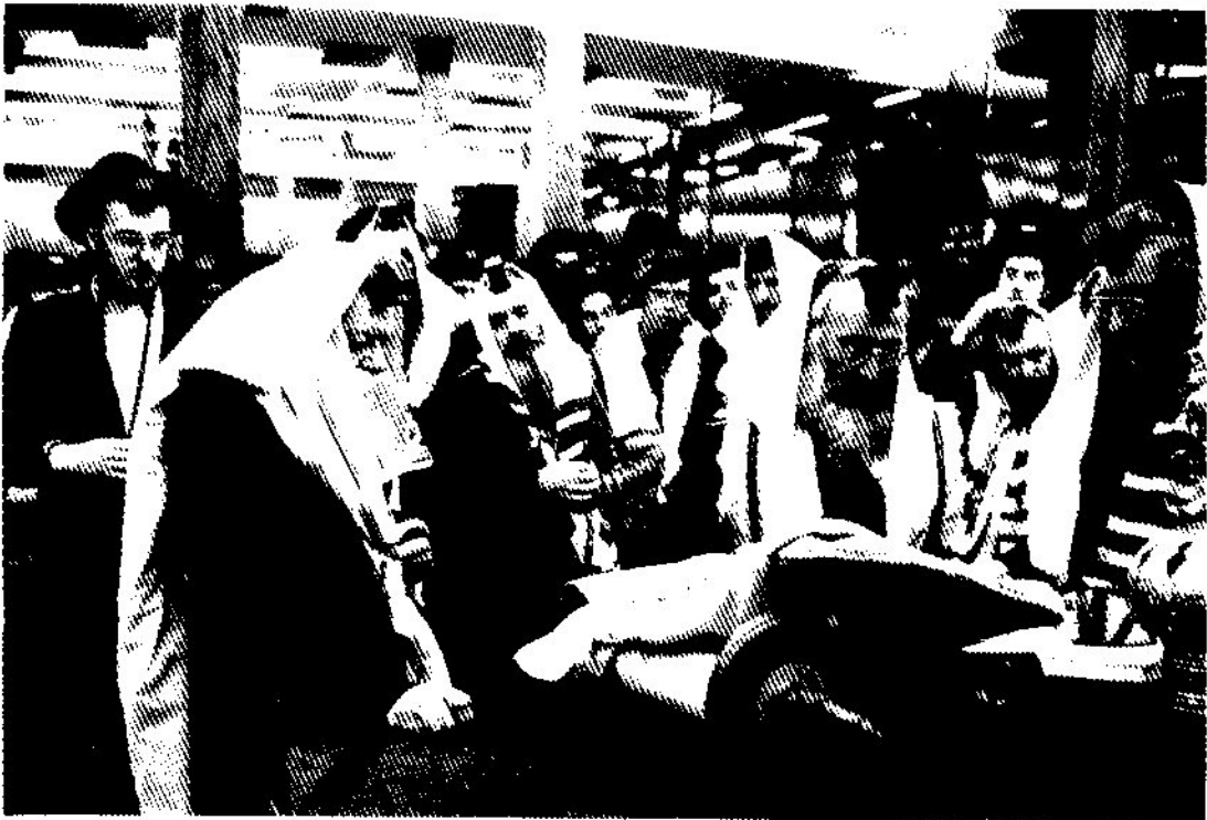
קריאת התורה יום שני ב' מרחשון

בצאתו בירך קבוצה גדולה של נוסעים בברכת: 'הצלחה רבה, בשורות טובות'. למעלה כשיצא מהמעלית בירך נוסעות בברכת: 'פארט גיונסערהייט, הערן בשורות טובות, זיין בהצלחה רבה'.