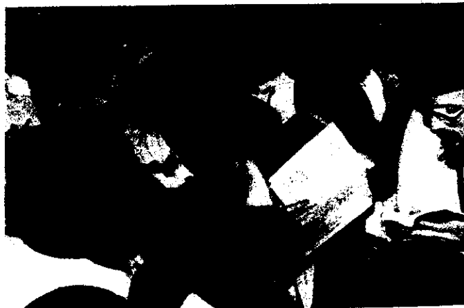
לאחרי תפלת ערבית יצא הרבי ל"קידוש לילה"

לתפלת ערבית הסיר את הטלית מראשו ולבש את הכובע, כנהוג. לאחר התפלה (והבדלה) פנה לקהל, ואמר בקול רם "גוט יו"ט", כשכל הקהל עונה אחריו, שלשה פעמים, וחזר לחדרו. כעבור כמה דקות יצא ל"קידוש-לבנה" כשהוא לבוש ביקיטלי ובטלית. משסיים, פנה אל העומדים