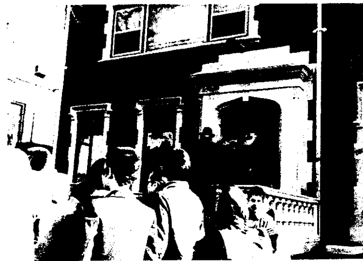
הרבי עומד כפתח הספריה. מלווה במבטו את חבילות המצות

גם לר' יקותיאל ראפ מארגן המשלוח נתן הרבי מכי כללי ו-1000 שקל (כני"ל). כמו"כ התעניין הרבי בזמני ההמראה והנחיתה (לפי שעון ישראל). בינתיים נארזו חמשת הארגונים והוכנו למשלוח. בהזדמנות זו הוציא ר' יקותיאל ש"י שני טפסים ממהדורת התניא שהודפסה בנמל התעופה קנדי ומסרם לרבי. הרבי שאל אם כבר קיבל $20, והורה לו למסור אח"כ במזכירות את מספר הטיסה, באחלו שיהי "בהצלחה רבה ומופלגה".