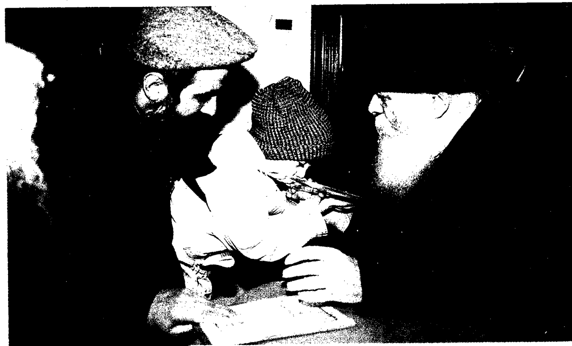
כ"ק אדמו"ר שליט"א בחלוקת הקונטרס - ברוך שעשה ניסים) בליל יו"ד שבט

לאחר התפילה נכנס כ"ק אדמו"ר שליט"א חזרו אשך זמן קצר, ולאחר מכן יצא