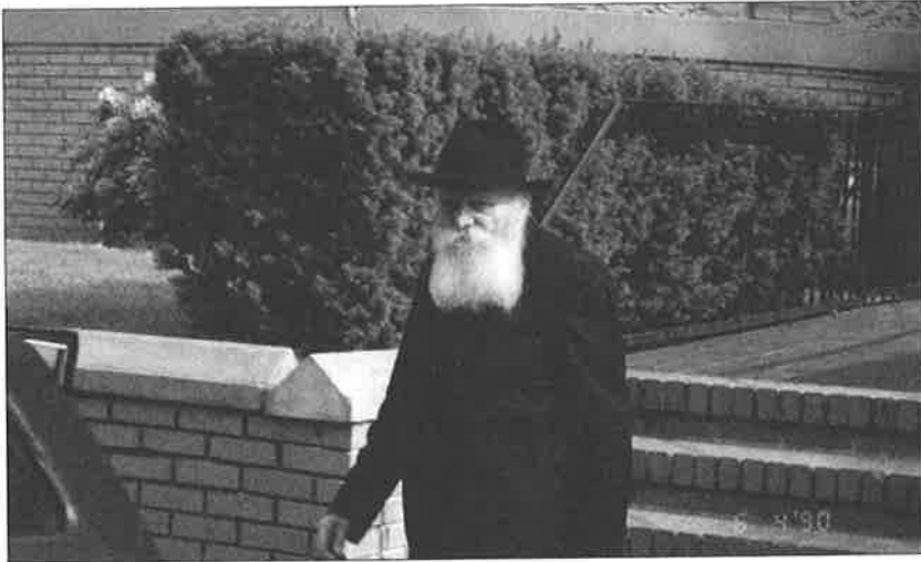
כ"ק אדמו"ר שליט"א ביציאתו מהמקוה