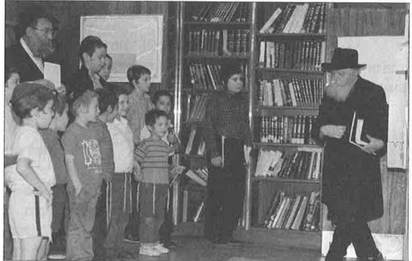
נכנס לתפילה בתשעה באב