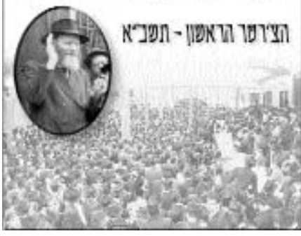
הציור הראשון - תשכ"א

במשך השנים – עד היום הזה – כבר הגיעו אלפים רבים לחצרות קודשנו, וכיום אין בכך ירבוא, אולם פריצת הדרך בתנאים הקשים של אותם ימים, כדאי שתישאר רשומה וזכורה גם בחלוף השנים.