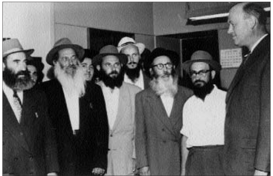
כמה מחברי הקבוצה אצל השגריר האמריקאי